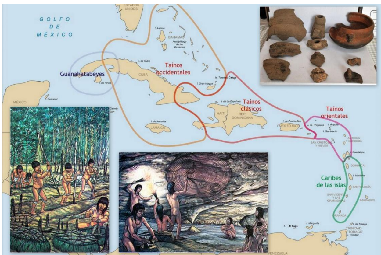
Ilustración 1. Poblamiento del Caribe a la llegada de los europeos y manifestaciones artísticas, cerámicas y agricultura de los aborígenes de Cuba