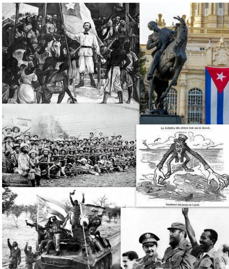
Ilustración 4. Guerras de Cuba e intervención en el exterior, 1868-1980

De derecha a izquierda y de arriba abajo Carlos Manuel de Céspedes en el alzamiento de Cuba contra España (1868), estatua de José Martí conmemorativa de su muerte en la guerra de independencia (1895), soldados españoles en la guerra de Cuba (1896), viñeta ilustrativa de la intervención de Estados Unidos en Cuba (1898), participación del ejército cubano en los conflictos africanos de Angola y Etiopía (1975-1991).