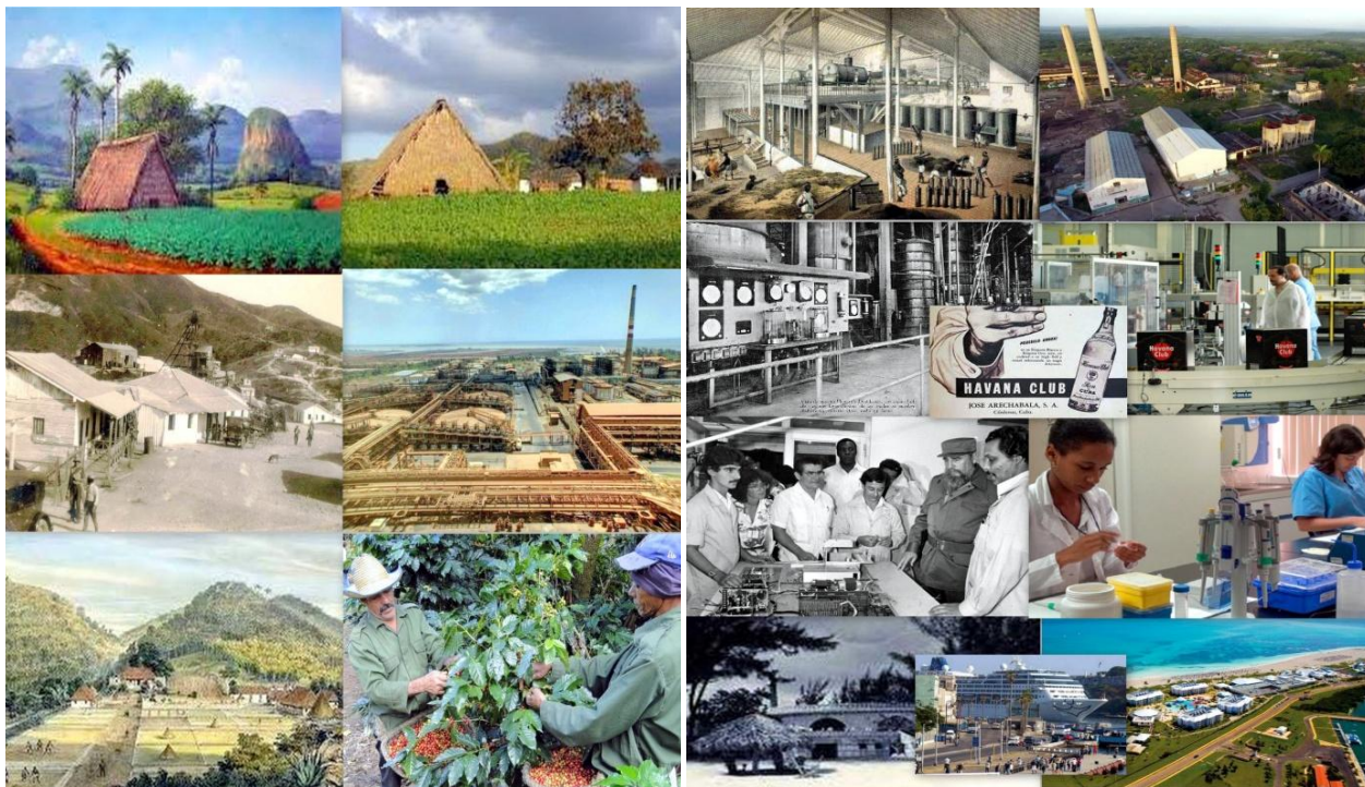
Ilustración 6. La economía cubana ayer y hoy

De derecha a izquierda y de arriba abajo vega y casa de tabaco en Pinar del Río en el siglo XIX y la actualidad, ingenio y central azucarero en 1857 y 2018, minas cubanas a principios del siglo XX y 2014, destilerías de ron hacia 1912 y en 2016 y anuncio de la marca Habana Club de 1920, Casto visitando un laboratorio farmacéutico cubano en la década de 1980 y laboratorio biotecnológico habanero en 2017, cafetal el oriente de Cuba a principios del siglo XIX y recolección de café en la isla en 2012, instalaciones turísticas de Varadero en las décadas de 1980 y 2010 y transatlántico entrando en el puerto de La Habana en 2018.