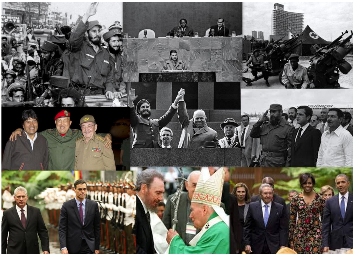
Ilustración 5. Imágenes de la revolución cubana y sus relaciones internacionales, 1960-2019

De derecha a izquierda y de arriba abajo. Fidel Castro entrando en La Habana en 1959, el Che en Naciones Unidas (1964), defensas en La Habana durante la crisis de los misiles (1962), Fidel Castro y Nikita Jrushchov en Moscú (1963), Evo Morales, Hugo Chávez y Raúl Castro en La Habana (2011), Fidel Castro y Adolfo Suárez en La Habana (1978), Miguel Díaz Canel y Pedro Sánchez en La Habana (2018), Juan Pablo II y Fidel Castro en Cuba (1998), Michelle y Barack Obama y Raúl Castro en Cuba (2016).